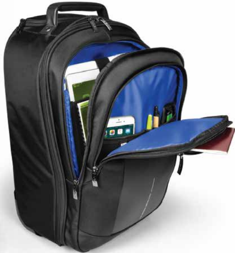
Padded laptop & tablet compartments and front organizer Compartiments matelassés pour ordinateur & tablette et organisateur frontal