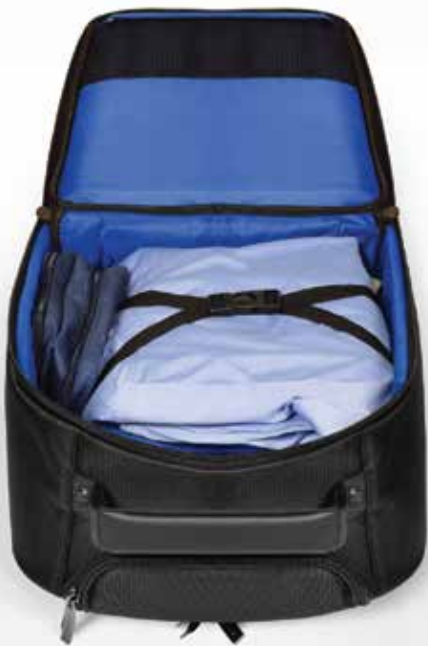
Main compartment for clothes and personal items Compartiment principal pour vêtements et effets personnels