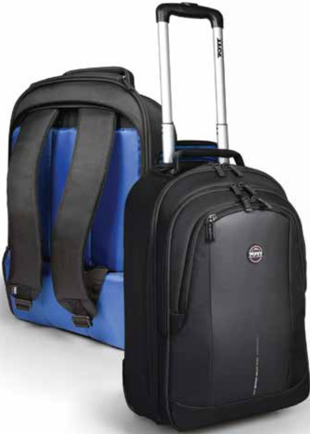
2 in1 convertible bag : backpack & trolley Sac convertible 2en1 : sac à dos & trolley