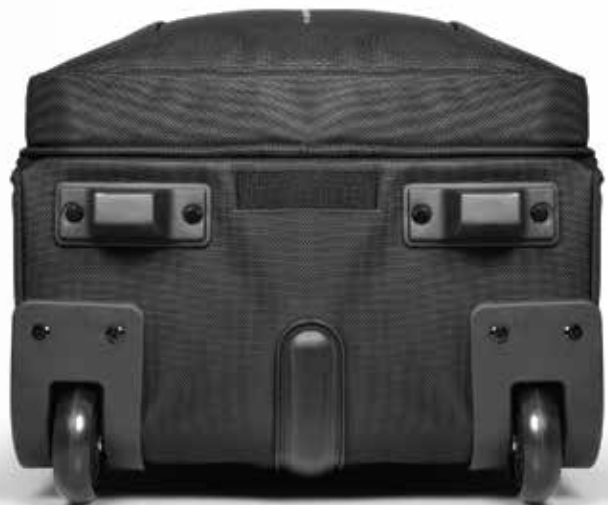
Bottom protection against shocks Barre de protection au fond du sac contre les chocs