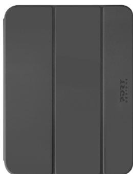
Dark Gray/Gris Anthracite